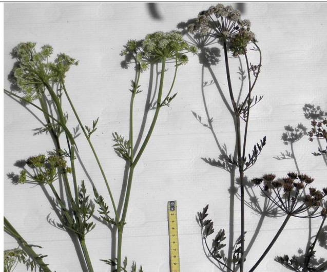
Oenanthe crocata , mi anthèse, 2 individus: sans rose - échelle - individu teinté de rose(tige, fleurs, fruits jeunes)