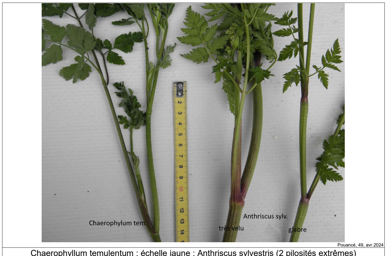
Chaerophyllum temulentum ; échelle jaune ; Anthriscus sylvestris (2 pilosités extrêmes)