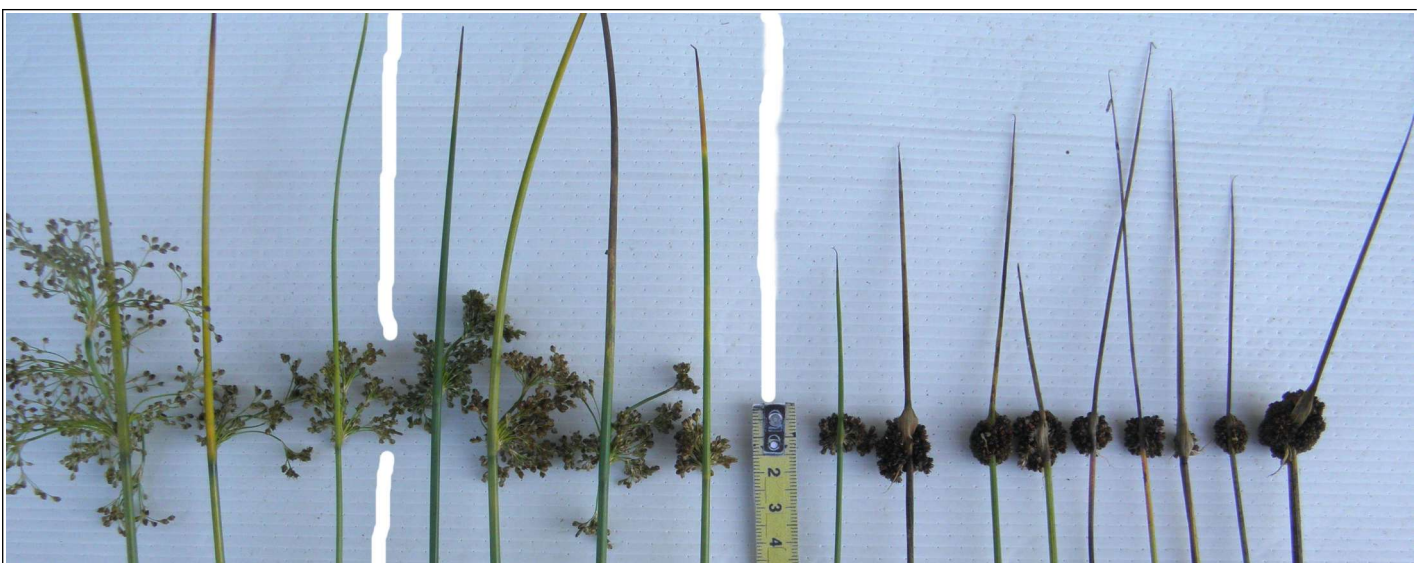
J. effusus 3 à fruits se formant ; 4 intermédiaires ; échelle ; J. conglomeratus mûr, un peu délavé (juil.2021)