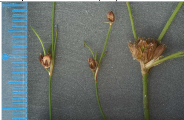
échelle ; J. supinus alpha (2 échantillons); beta (1 échantillon)

cf descriptions in ERICA (1996) n° 8:57-58. Parfois quelques intermédiaires. Le nombre d'E est difficile pour plusieurs raisons, parfois en partie mal formées ; majorité de fleurs à 6 E chez alpha.