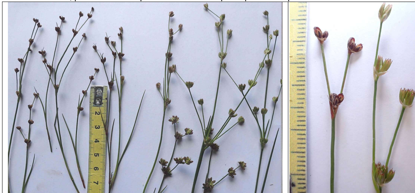
alpha règle (2intermédiaires?) beta

Dans la littérature, parfois 2 sous-espèces mais de description quasi incompréhensible.