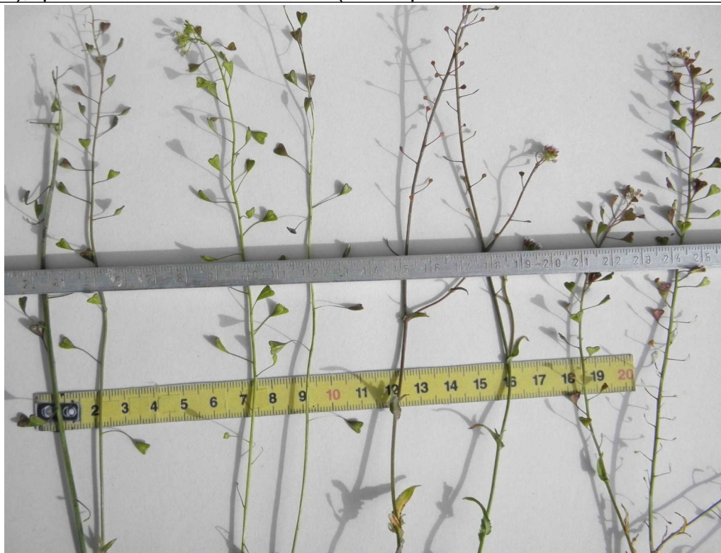
C.b.-p.(2 infl.d'1 individu) ; 2 intermédiaires fertiles ; interm.stérile* (2 infl. d'1 ind.) ; C.rubella (2 infl.) photo à zones de fleurs parfois dévorées par des escargots *fruits avortés (ovales plats, 1-2 mm); (Martigné-Brillant, ML, avril 2023)

intermédiaire, parfois fertile (FE), Capsella x gracilis infl.longue et capsules réduites ou nulles, stérile(Sta2015);+prob. infructescences mixtes (des capsules avortées + d'autres développées)