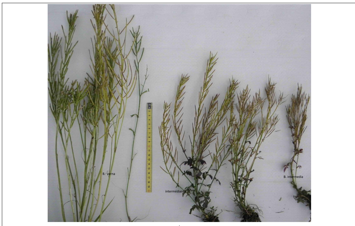
Barbarea verna ; 3 individus intermédiaires avec échelle entre n°1 et 2 ; B. intermedia (juil 2021, surtout échantillons de Kerbeneuc)

Des intermédiaires entre B. verna et B. vulgaris existent probablement et probablement assez commun au moins en présence de 2 espèces :