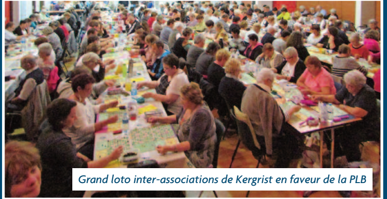
Grand loto inter-associations de Kergrist en faveur de la PLB