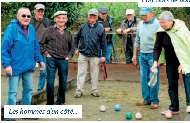
Les hommes d'un côté...