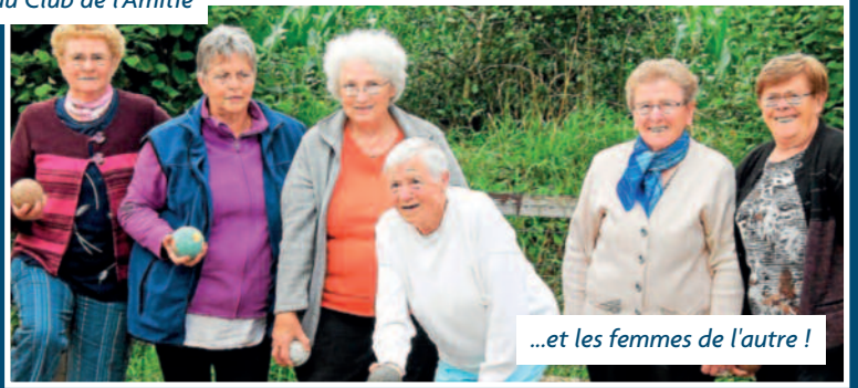
...et les femmes de l'autre !