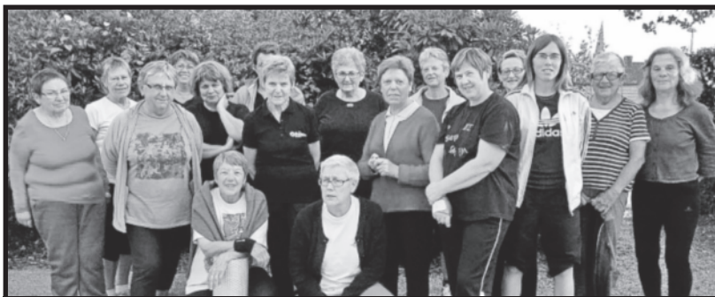
La rentrée de la gym de Kergrist (Où sont cachés les garçons ?)