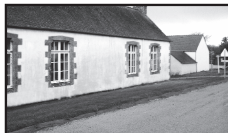
L'arrière de l'école, moitié pelouse, moitié parking est bordé de boutures de rosiers.

Les travaux autour et derrière l'école se poursuivent. Deux portes neuves ont été posées aux pignons. De plus des marquages au sol ont été effectués par une entreprise spécialisée à la demande de la mairie pour délimiter un terrain de foot, des circuits pour les vélos et des jeux comme la marelle.