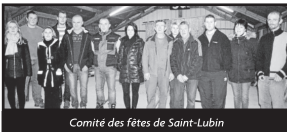
Comité des fêtes de Saint-Lubin