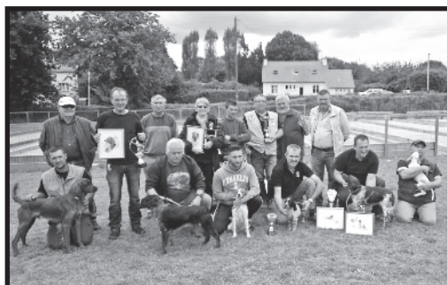
Les primés et leurs chiens à la fête de la chasse en septembre à Saint Lubin