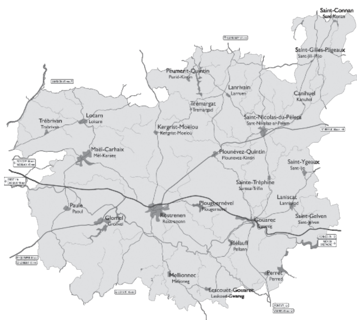
LES 25 COMMUNES DE LA CCKB (pop.légale recens. 2013)