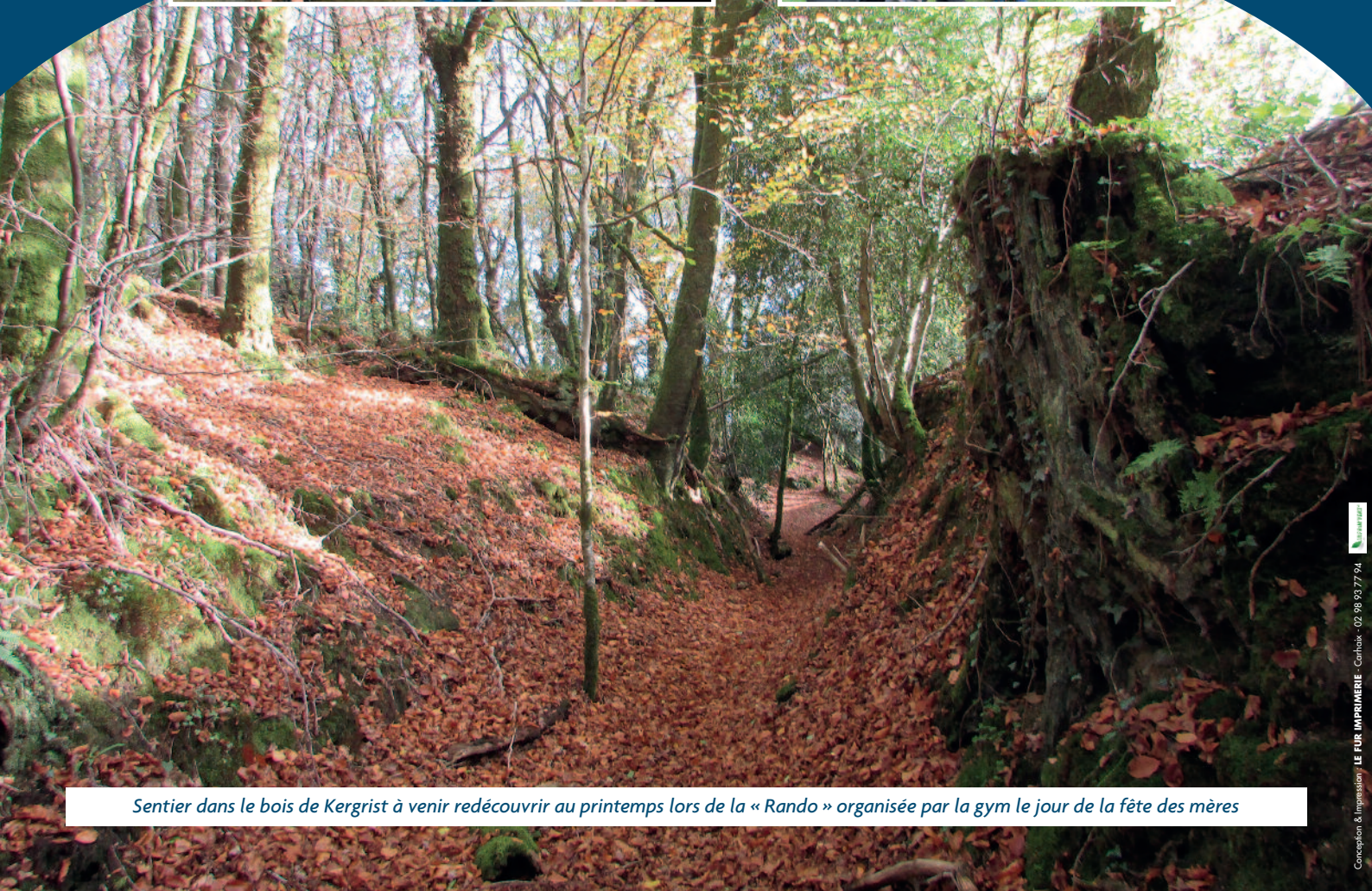
Sentier dans le bois de Kergrist à venir redécouvrir au printemps lors de la « Rando » organisée par la gym le jour de la fête des mères