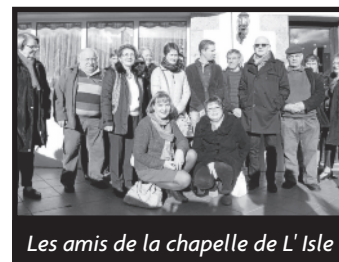
Les amis de la chapelle de L' Isle