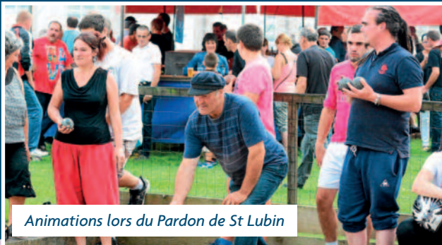
Animations lors du Pardon de St Lubin