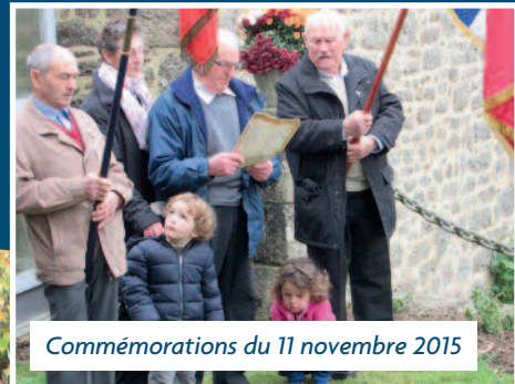
Commémorations du 11 novembre 2015