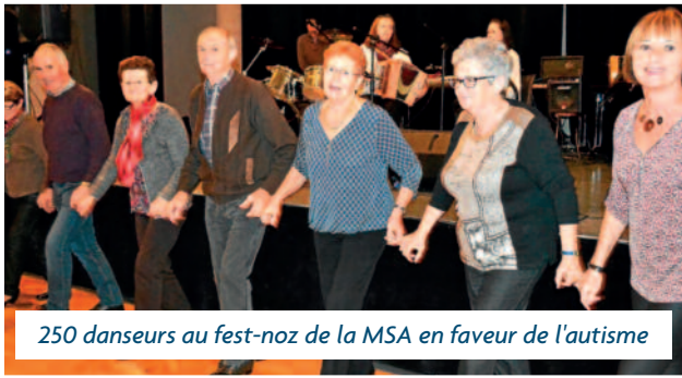
250 danseurs au fest-noz de la MSA en faveur de l'autisme