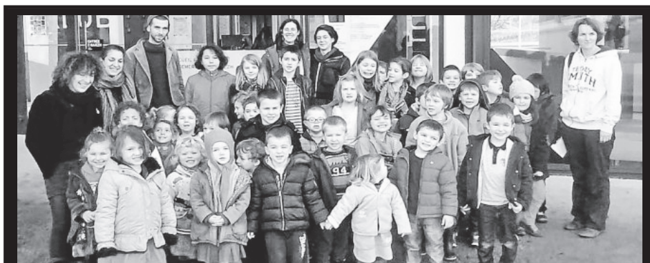
les enfants au spectacle de Patrick Ewen avant Noël à Carhaix

breton pour le spectacle de Noël et Pascaline espère vivement pouvoir participer avec eux au Kan ar Bobl cette année ! Chañs vat !