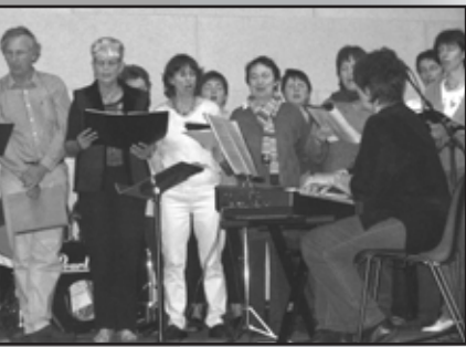
5 juin Chorale et prestation de l'école de musique