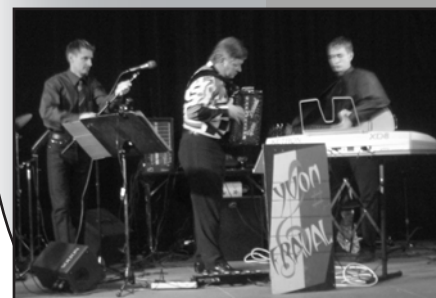
Paotred al Loc'h Et Galern