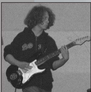
21 mai Soirée Rock avec Némésis et Principe Actif