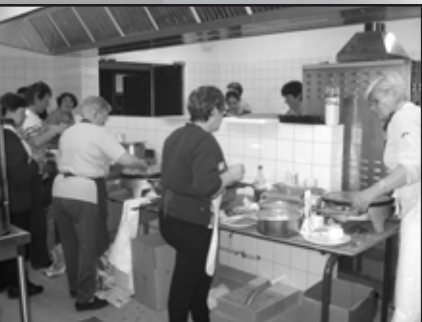
19 mars Soirée crêpes USK et Club de Gym