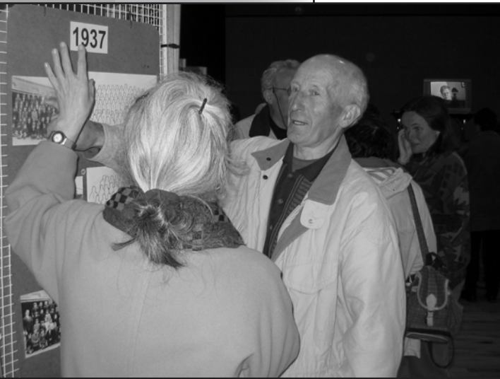
Rencontres photographiques Retrouvailles de visages Mémoires des noms

Échanges à travers le temps Entre anciens élèves et anciens enseignants