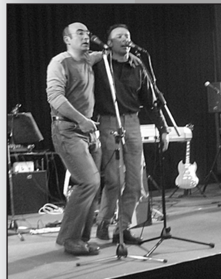
Fest-Noz et Bal