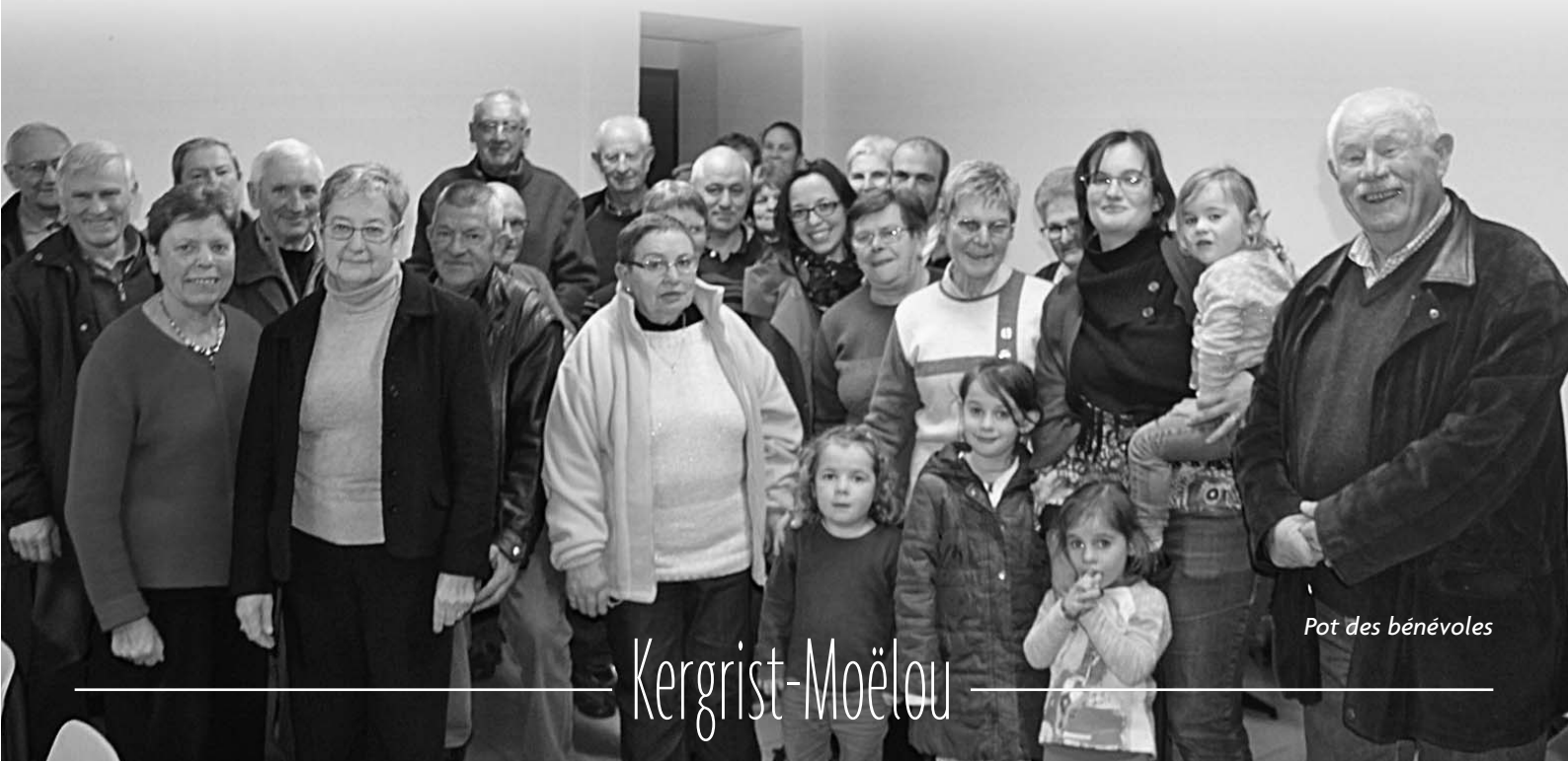
Pot des bénévoles