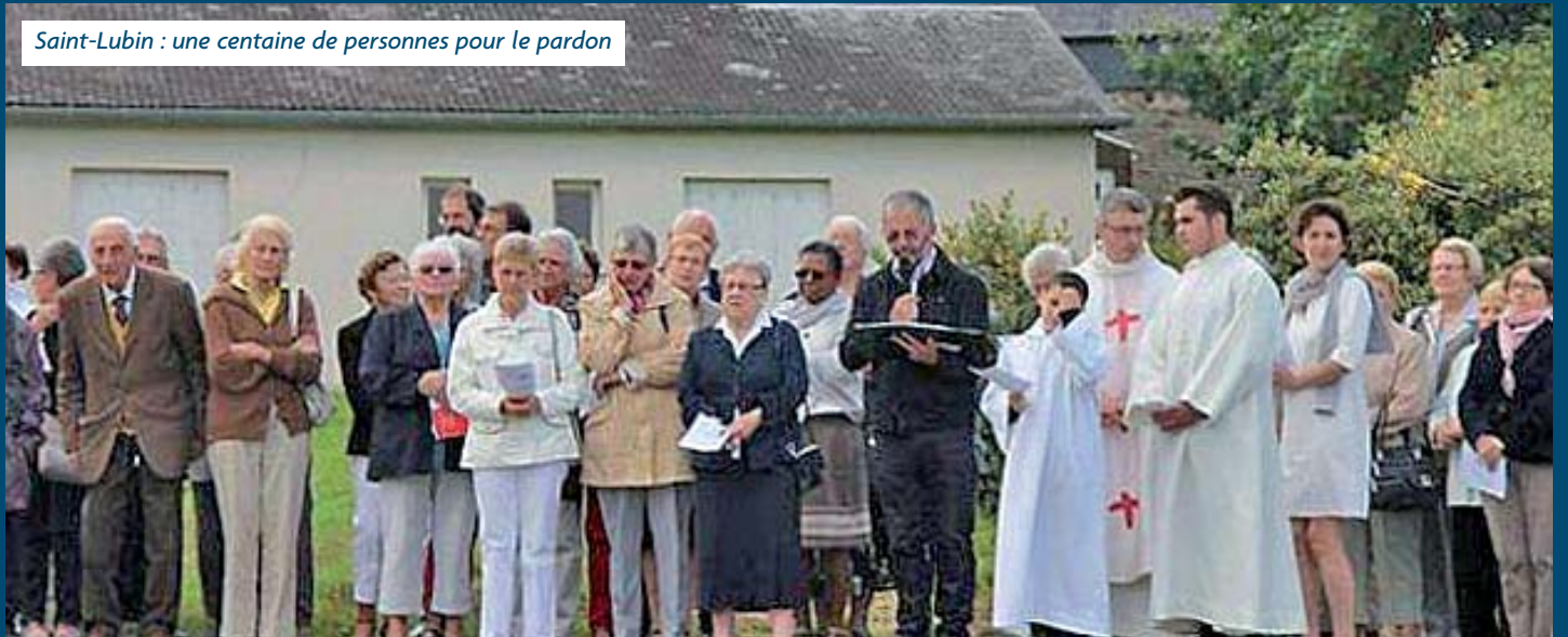
Saint-Lubin : une centaine de personnes pour le pardon