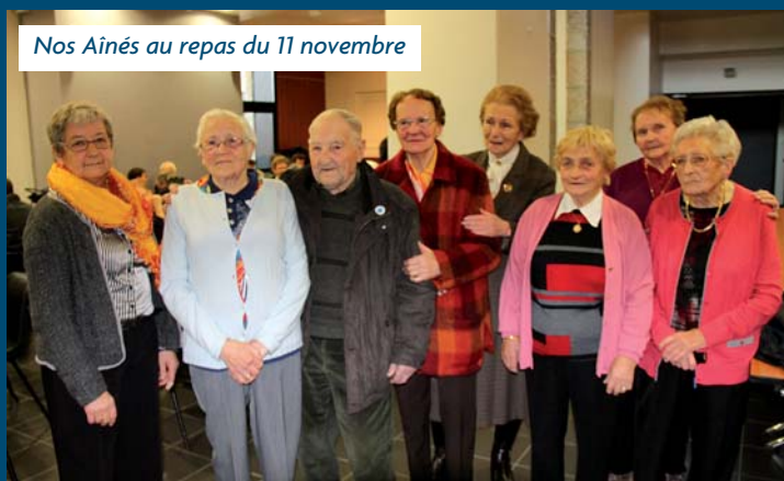
Nos Aînés au repas du 11 novembre