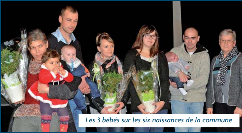
Les 3 bébés sur les six naissances de la commune