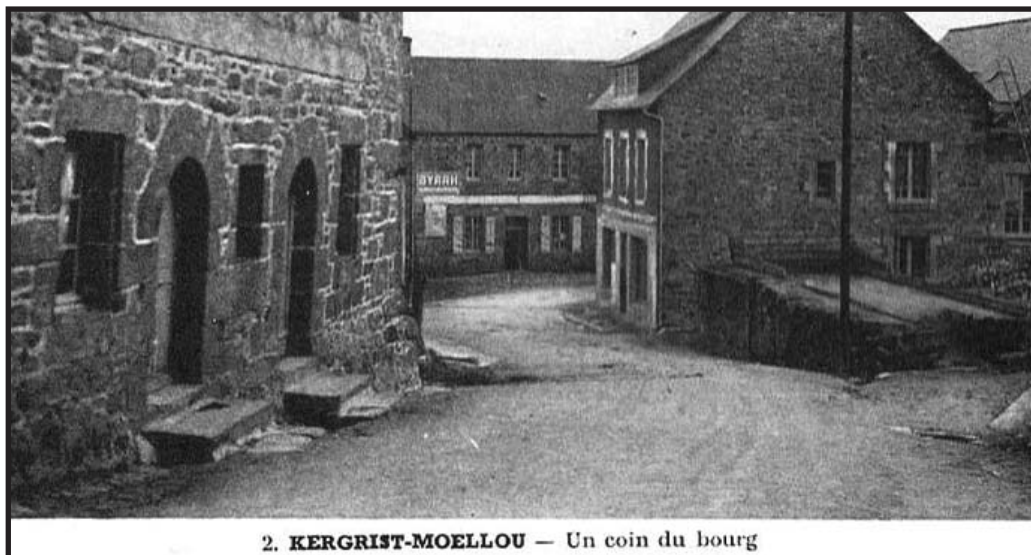
2. KERGRIST-MOËLOU — Un coin du bourg

Un dossier de demande de subvention est à retirer en mairie ou sur le site Internet des CPRB ( www.cprb.org ).