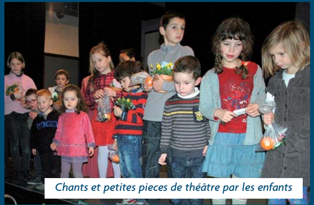
Chants et petites pièces de théâtre par les enfants