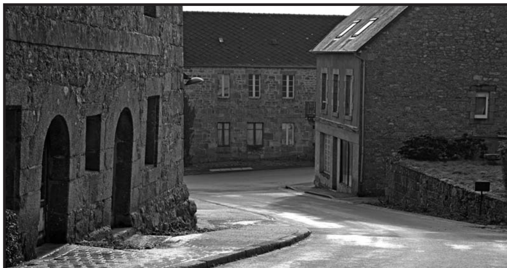
Le bourg aujourd'hui