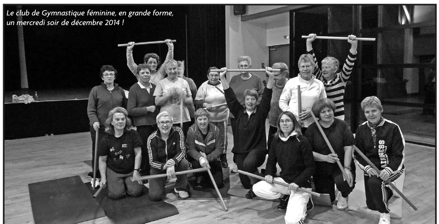
Le club de Gymnastique féminine, en grande forme, un mercredi soir de décembre 2014 !