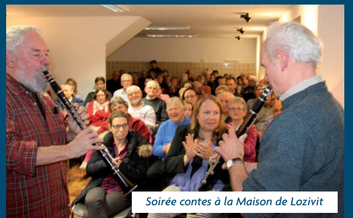
Soirée contes à la Maison de Lozivit