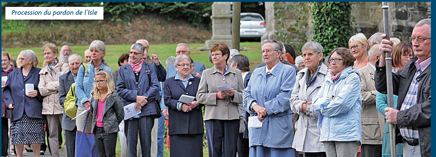
Procession du pardon de l'Isle