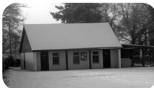
Les vestiaires ont quant à eux, ont été repeints