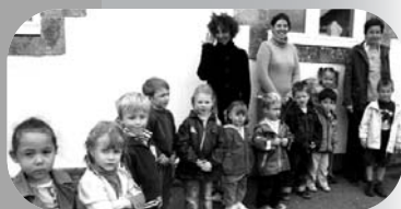
Les enfants en compagnie de l'équipe enseignante le jour de la rentrée