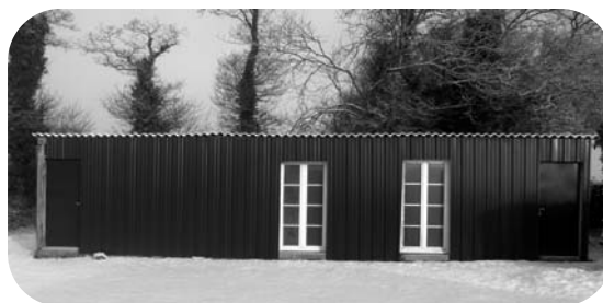
Réfection du bardage de l'ancienne buvette du stade par des bénévoles