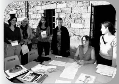
L'association Arts et Cob a présenté sa plaquette "Scènes en herbe" lors d'une réunion à Kergrist le 14 septembre dernier