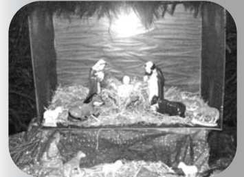
La crèche réalisée par l'équipe paroissiale