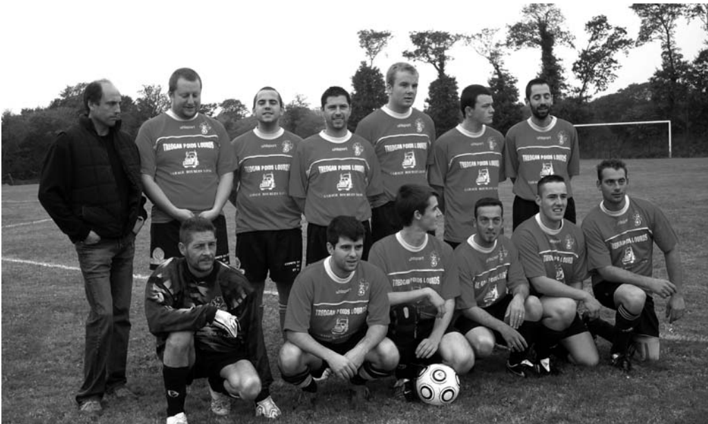
Equipe C :

Une bande de bon copains, mais aussi le réservoir potentiel pour les équipes A et B