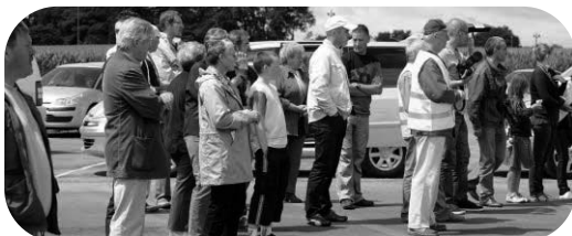
Passage de la KBE le 26 juillet.

Renouvellement de la convention entre la Satèse et la commune pour l'assistance technique de la lagune jusqu'en 2012 pour un coût annuel de 450 €uros. Le conseil n'envisage pas de revalorisation de la redevance assainissement pour 2010.