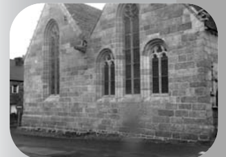
La facade Nord après rejointement