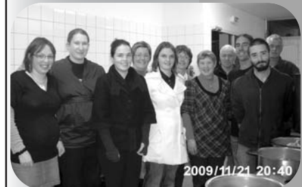
Une infime partie des bénévoles de l'USK à la soirée Potée du 21 novembre