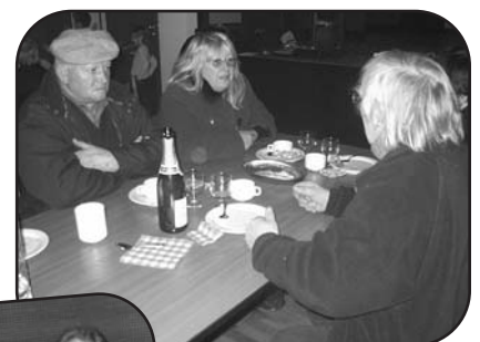
Lors de la soirée des Vœux du Maire...