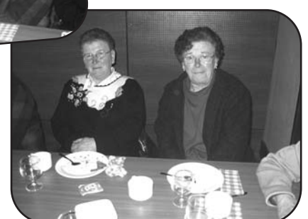
D'autres photos page 15...